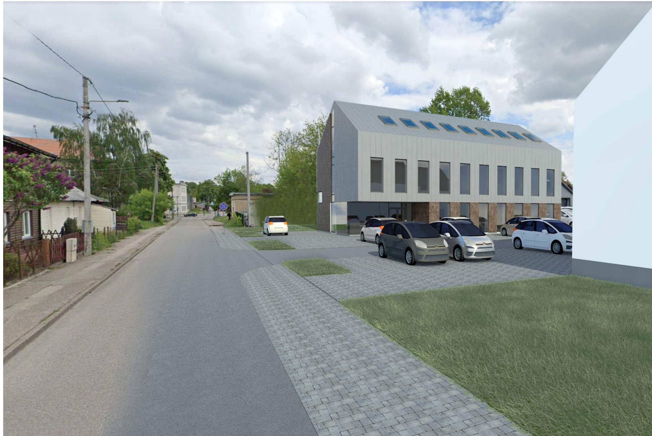
NUO VOKIEČIŲ G. PUSĖS