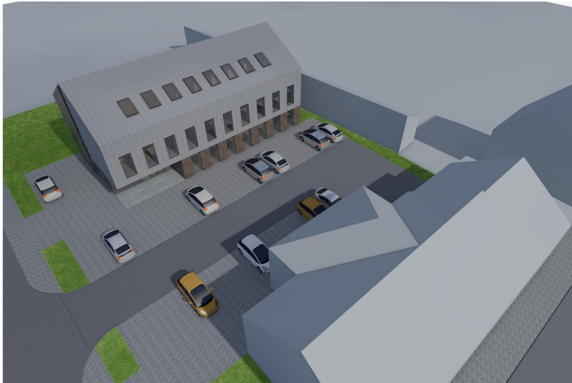
VAZDAS IŠ VIRŠAUS