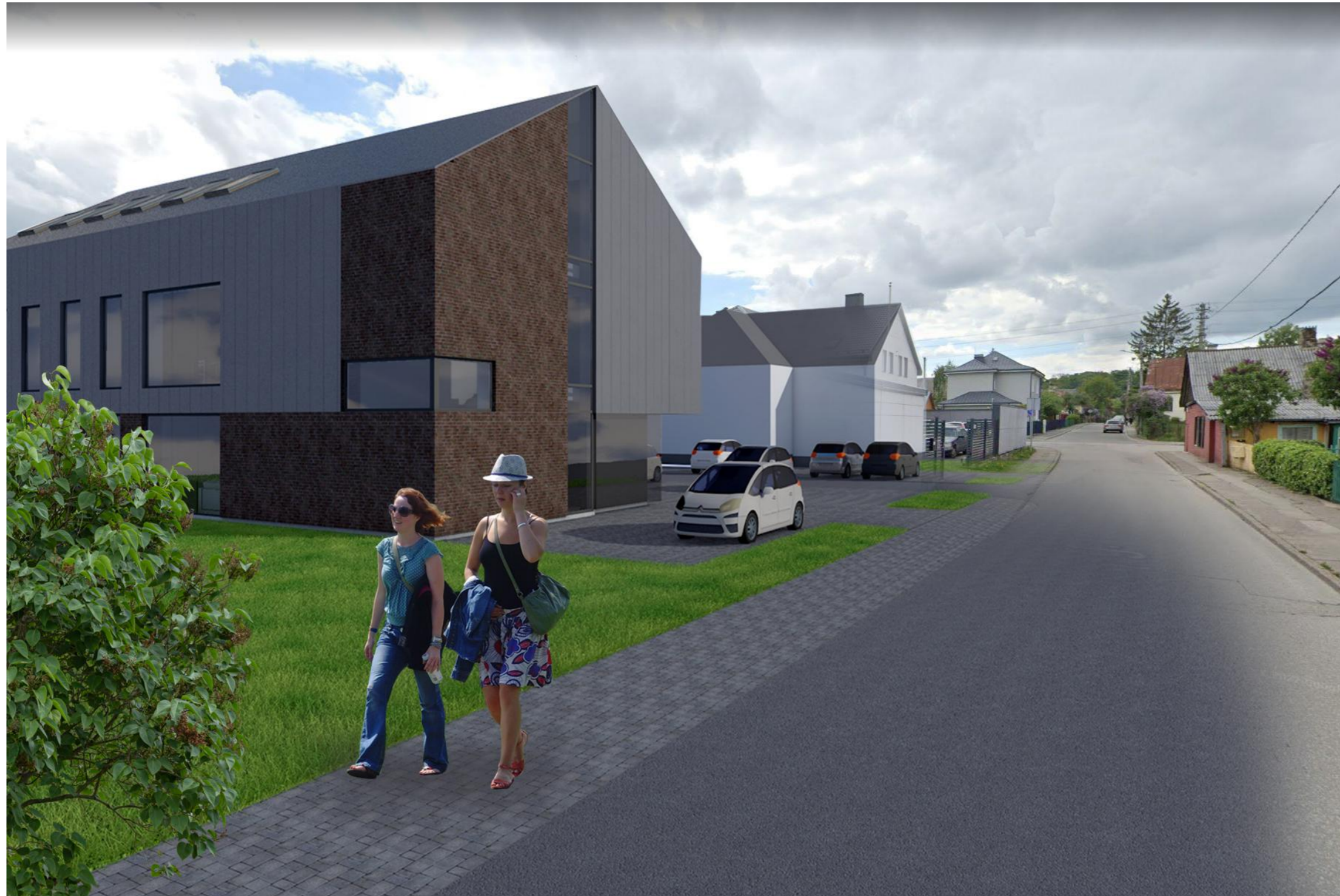
NUO JUOZAPAVIČIAUS PR. PUSĖS