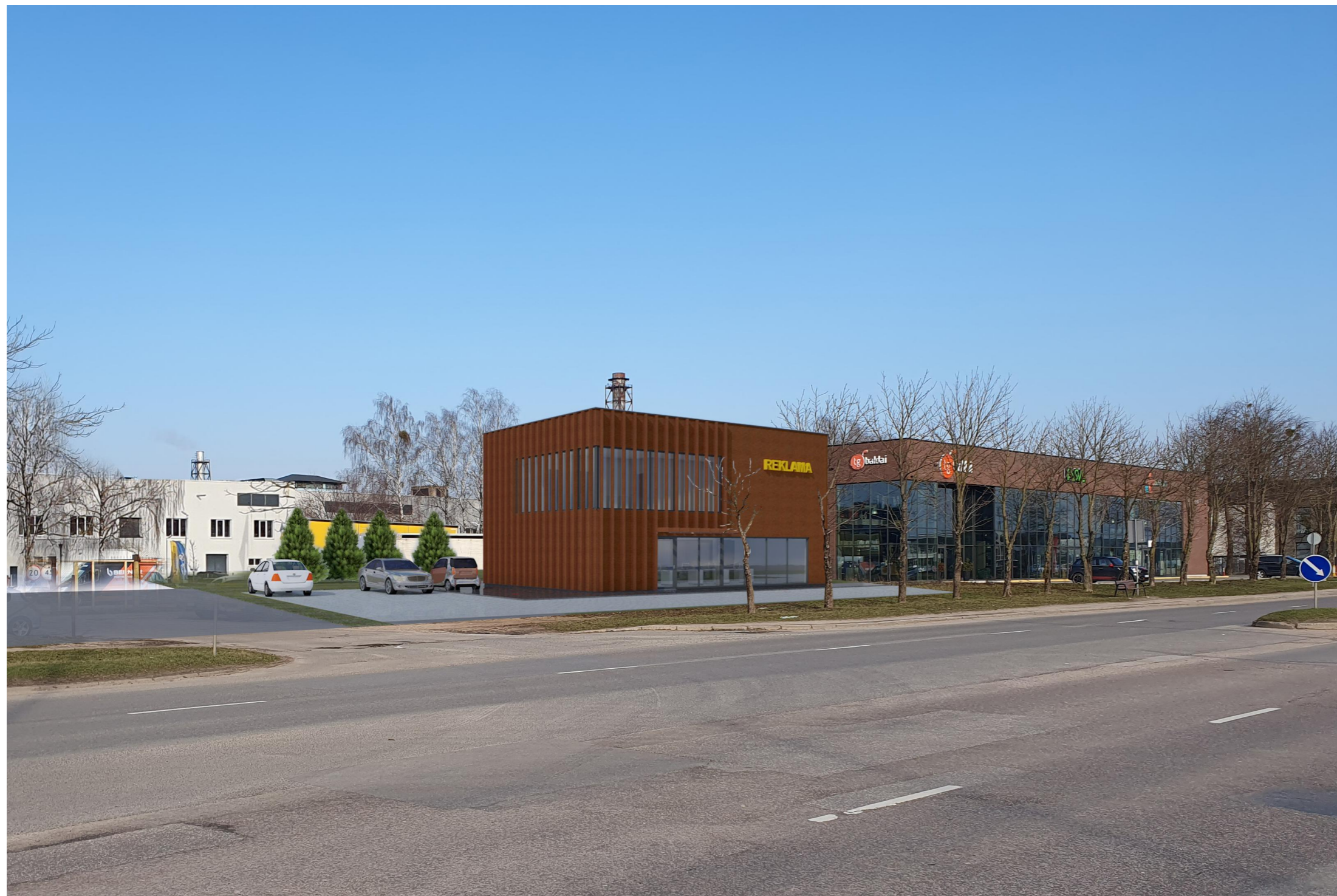
VAIZDAS NUO PRAMONĖS PR. PUSĖS