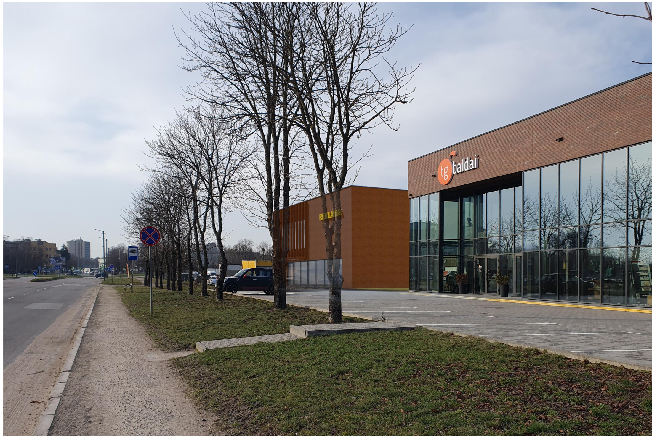
VAIZDAS NUO PETRAŠIŪNŲ PUSĖS