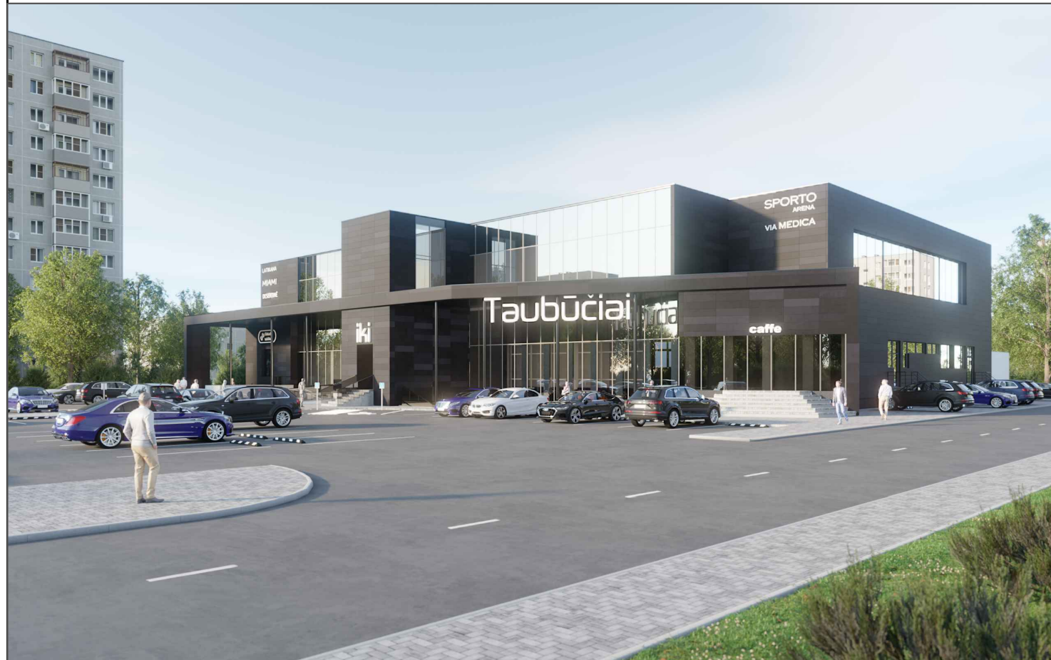
VIZUALIZACIJA NR. 1- Iš pietinės pusės