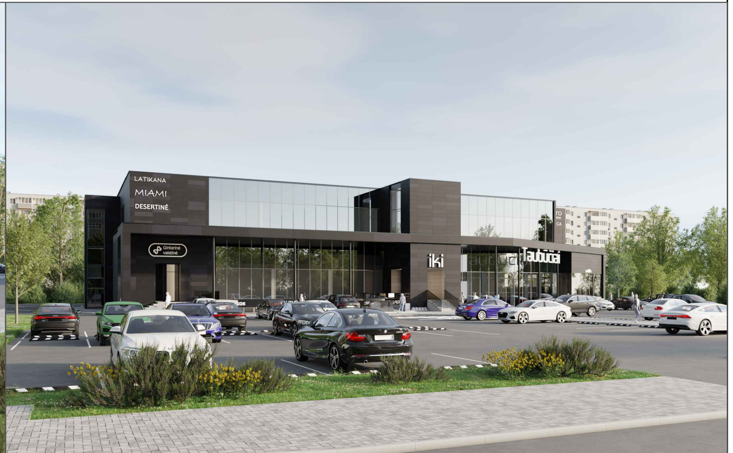
VIZUALIZACIJA NR. 2- Iš vakarinės pusės